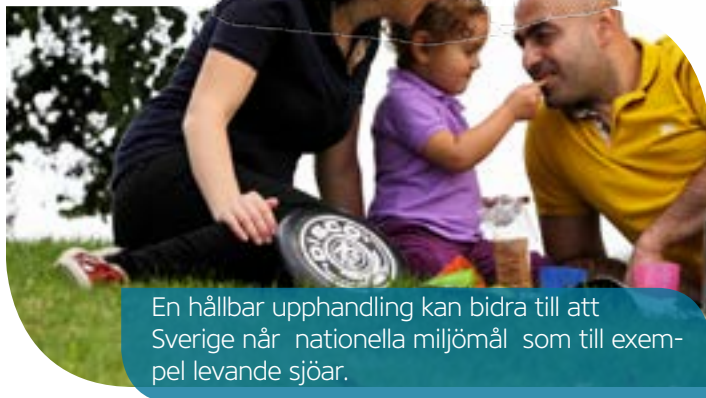
En hållbar upphandling kan bidra till att Sverige når nationella miljömål som till exempel levande sjöar.

Vi rekommenderar att man väljer att kräva märkning såsom ett tilldelningskriterium/börkrav om den upphandlande myndigheten ännu inte har klart för sig hur marknadstillgången på miljömärkta produkter ser ut. Genom att använda miljömärkning som del av anbudsutvärderingen avvägs önskan om miljöhänsyn mot andra faktorer,